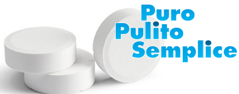
TABELLA DOSAGGIO (Ciascuna pastiglia AquaFinesse® POOL è sufficiente per un trattamento settimanale di 5200 galloni / 20000 litri)